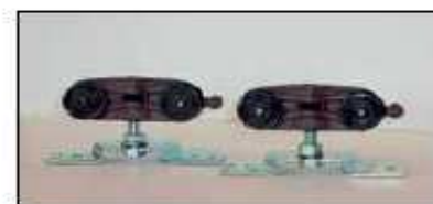
Carrelli di scorrimento con portata 100 kg