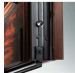
LAMINA PARAFREDDO COLD EXCLUDING SILL