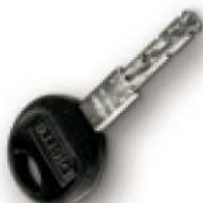
Chiave standard Standard key