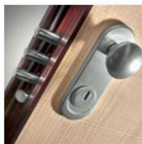
DEFENDER (presto disponibile) DEFENDER (available soon)