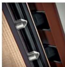
ROSTRO FISSO FIXED GRIP

The Block deviator on the bottom and upper side, controlled by the lock, fits in the frame and anchors and firmly blocks the door. A steel bushing, the Defender, surrounds the cylinder thus protecting the outer side of the lock, increasing resistance to break-in tools. The flush with the floor cold excluding sill, indispensable detail for a security door, protects from drafts of air and blades of light, returning automatically when the door is opened.